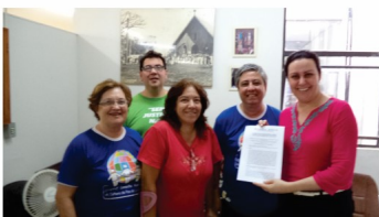
Secretária de Cultura Solange Batiglina