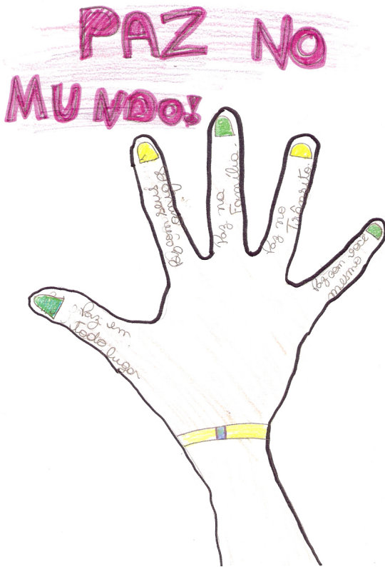
Isabella Menezes da Cunha | 4ª Série | 10 anos | desenho