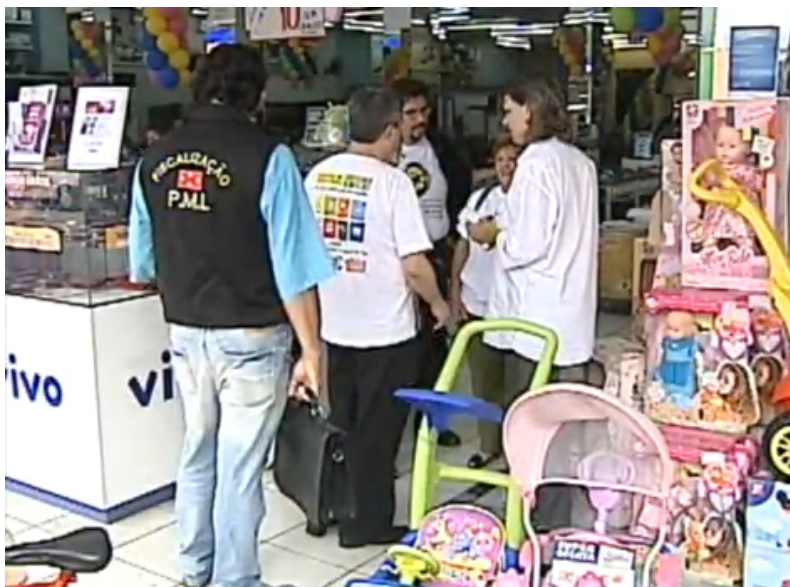
Site da Prefeitura Municipal de Londrina

em out/2011 Neste assunto em Londrina, mesmo com relação conflituosa a Prefeitura Municipal de Londrina e Câmara Municipal estão trabalhando junto com a sociedade civil nesta campanha para não vendermos as armas de brinquedo.