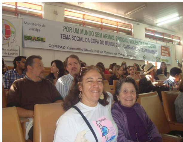
Esta foto Jorge Correia/UEL

http://www.londrinapazeando.org.br/index.php?option=com_content&view=article&id=607&catid=8&Itemid=48